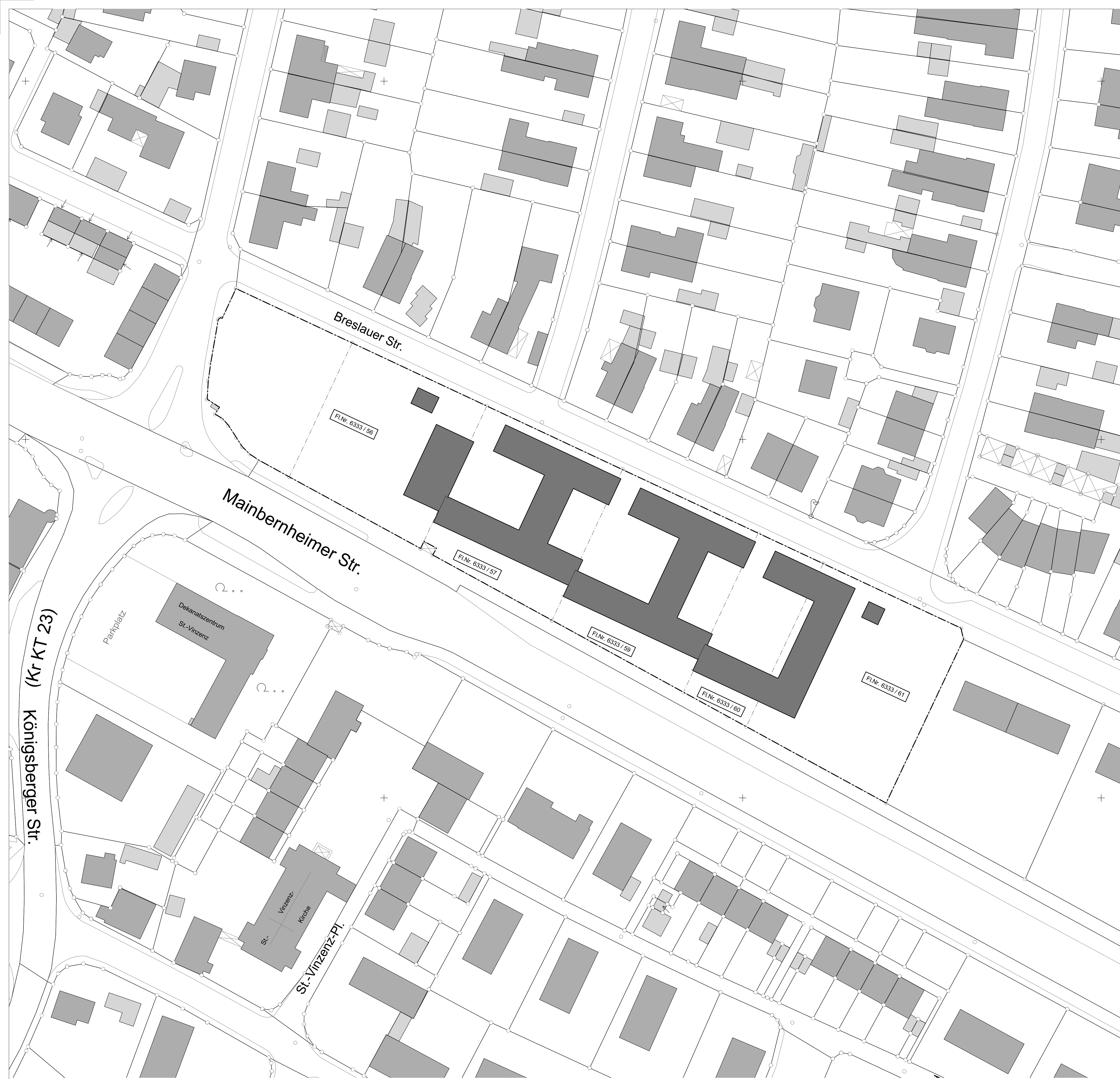
Lageplan 1:500, genordet