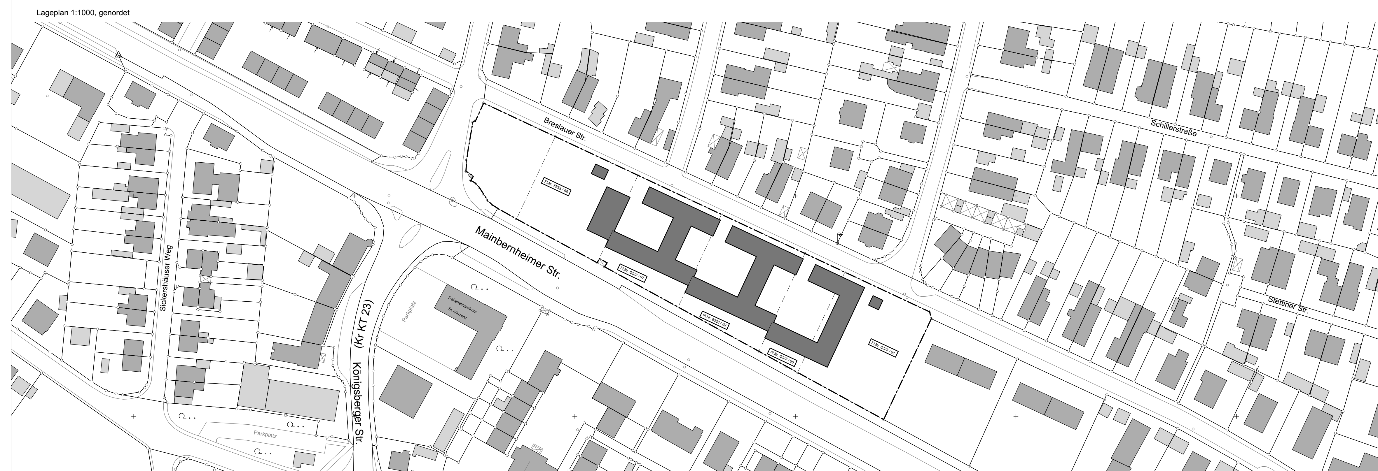
Lageplan 1:1000, genordet